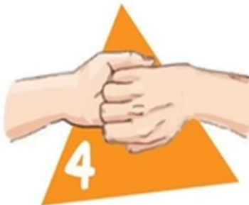
И про ногти