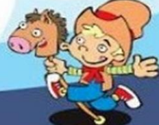
после игр и занятий спортом