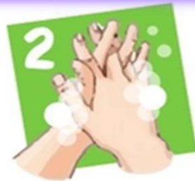
Промываем между пальцев