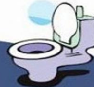
после посещения туалета