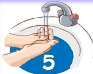
Споласкиваем руки теплой водой