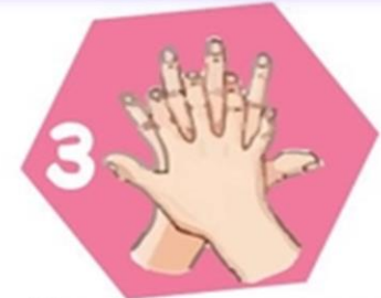
Не забываем про тыльную сторону рук