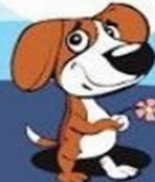
после общения с животными