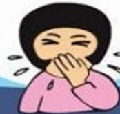
после кашля и чихания