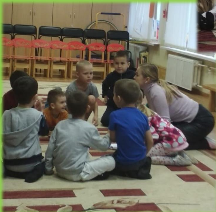
Развлечение «Эмоции» в старшей группе.