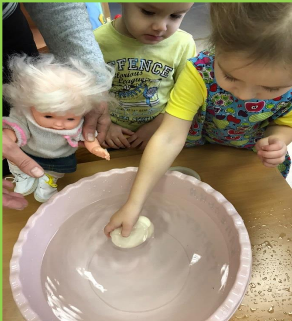
«Научим куклу Катю мыть руки»