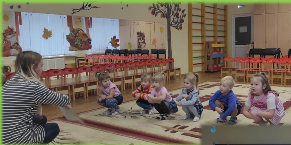
Утренняя зарядка, подвижные игры.

В нашем детском саду для детей проводятся различные мероприятия, направленные на повышение значимости здорового образа жизни в каждой возрастной группе.