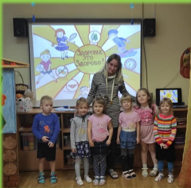
«Чистим зубы по утрам и вечерам»